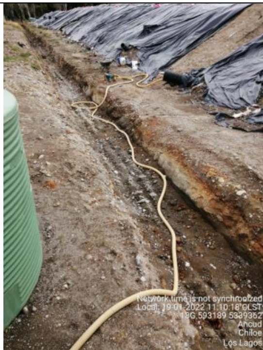
Fotografía N°6: Retiro de Lixiviados desde diagonal D02. Tomada: Miércoles 19 de Enero del 2022.