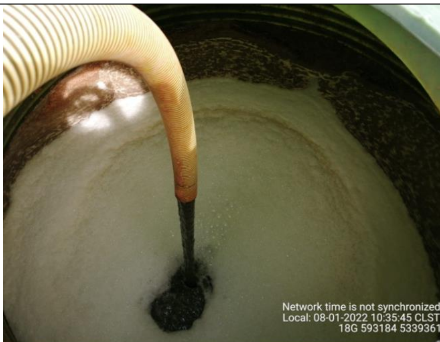
Fotografía N°5: Retiro de Lixiviados a estanque por Personal Municipal. Tomada: Martes 18 de Enero del 2022.