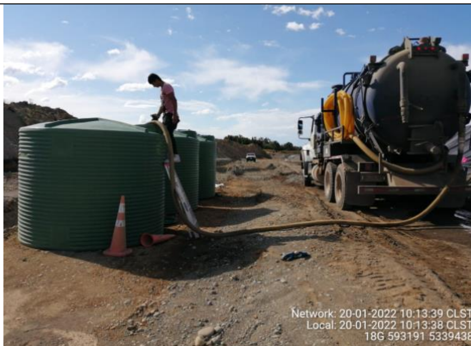
Fotografía N°9: Retiro de Lixiviados por empresa Tresol desde estanques. Tomada: Jueves 20 de Enero del 2022.