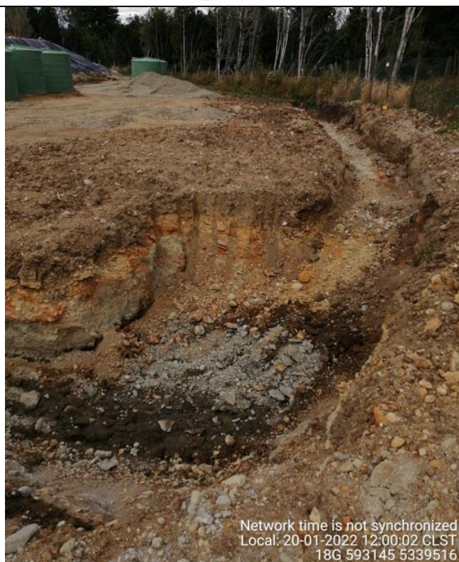
Fotografía N°25: Estado canales aguas lluvias