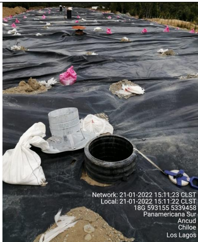
Fotografía N°20 Medición de Niveles de cámaras por Personal Municipal. Tomada: 21 de Enero del 2022.