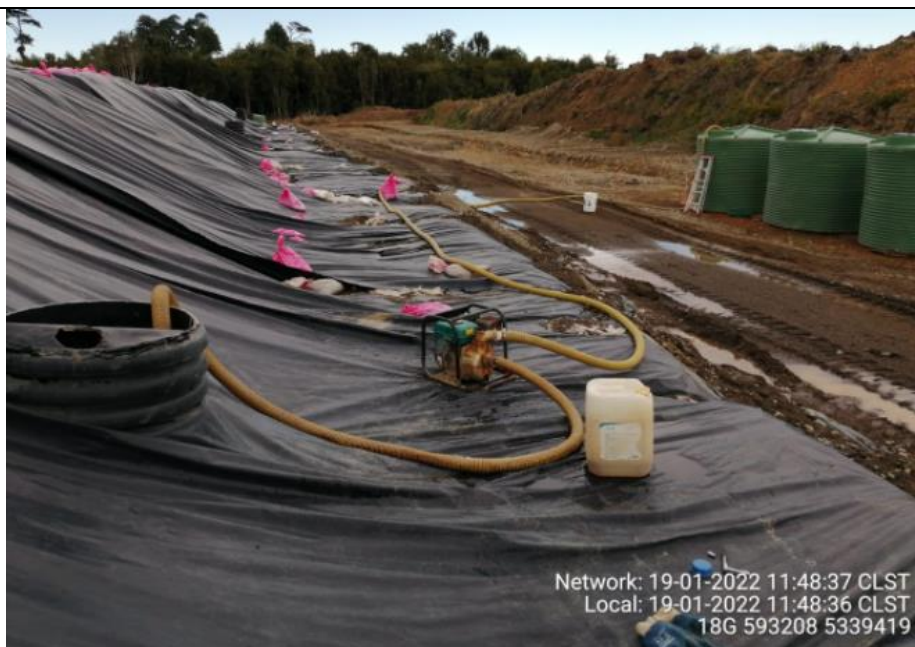
Fotografía N°7: Retiro de Lixiviados desde Cámara C13. Tomada: Miércoles 19 de Enero del 2022.