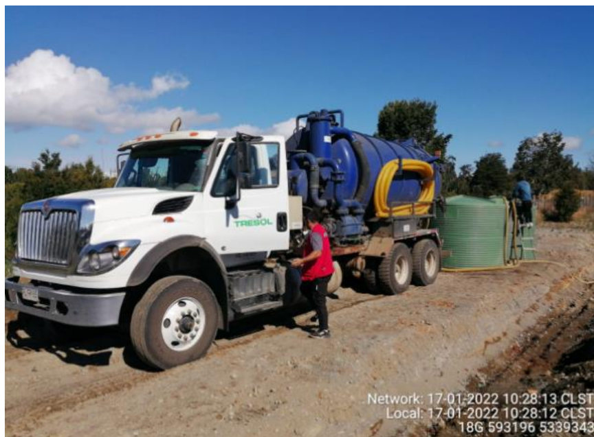
Fotografía N°1: Retiro de Lixiviados por empresa Tresol. Tomada: Lunes 17 de Enero del 2022.

Para dar cumplimiento a lo indicado en Res. Exenta N°86, emitida con fecha 19 de Enero del 2022. A continuación, se presenta el registro fotográfico de las actividades de extracción de la semana del 17-23 de Enero del 2022.