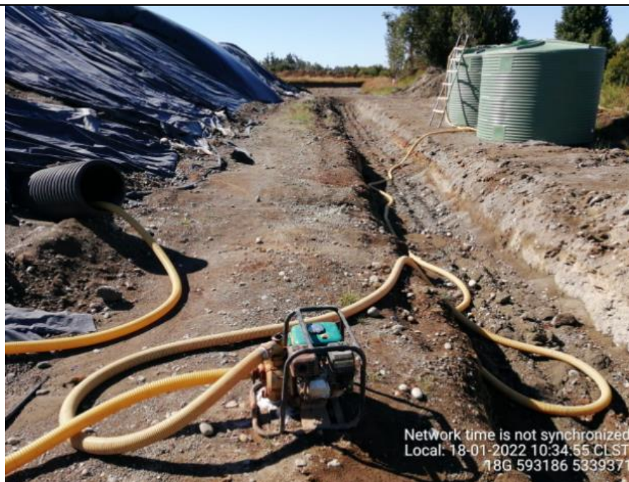
Fotografía N°4: Retiro de Lixiviados desde diagonal D02. Tomada: Martes 18 de Enero del 2022.