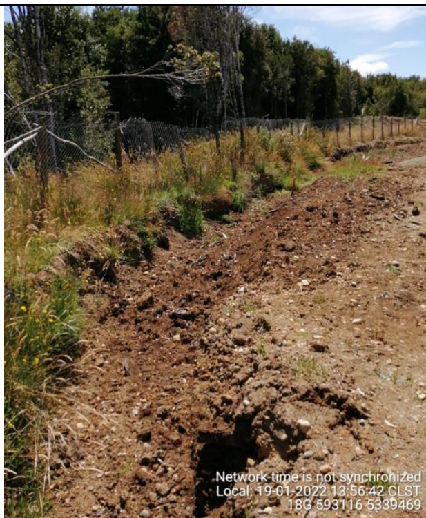
Fotografía N°24: Estado canales aguas lluvias