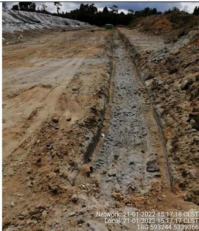
Fotografía N°26: Estado canales aguas lluvias