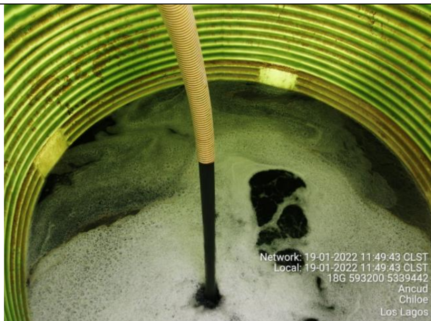
Fotografía N°8: Retiro de Lixiviados a estanque por personal municipal. Tomada: Miércoles 19 de Enero del 2022.