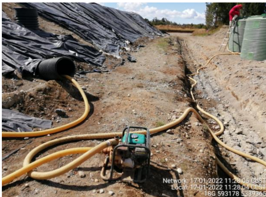
Fotografía N°2: Retiro de Lixiviados desde D02 y D03 por Personal Municipal. Tomada: Lunes 17 de Enero del 2022.