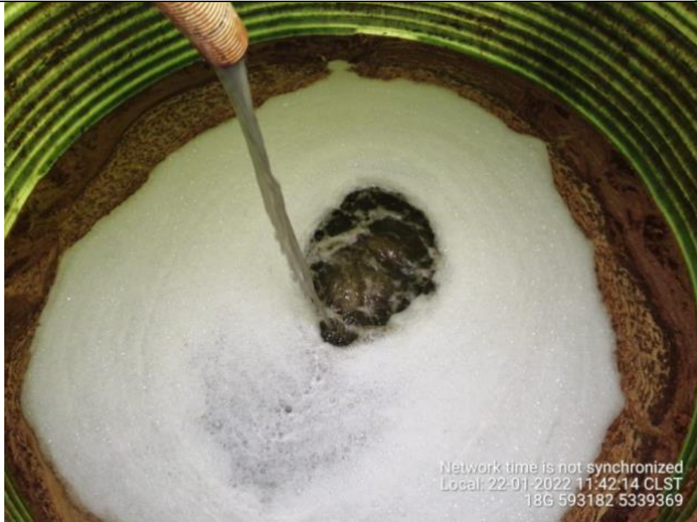
Fotografía N°14: Extracción de Lixiviados a estanque por personal municipal. Tomada: Sábado 22 de Enero del 2022.

Respecto a los retiros de lixiviados se mencionan en la siguiente tabla el cronograma y Cantidad de lixiviados retirados por jornada correspondiente del 17-23 De Enero del 2022.