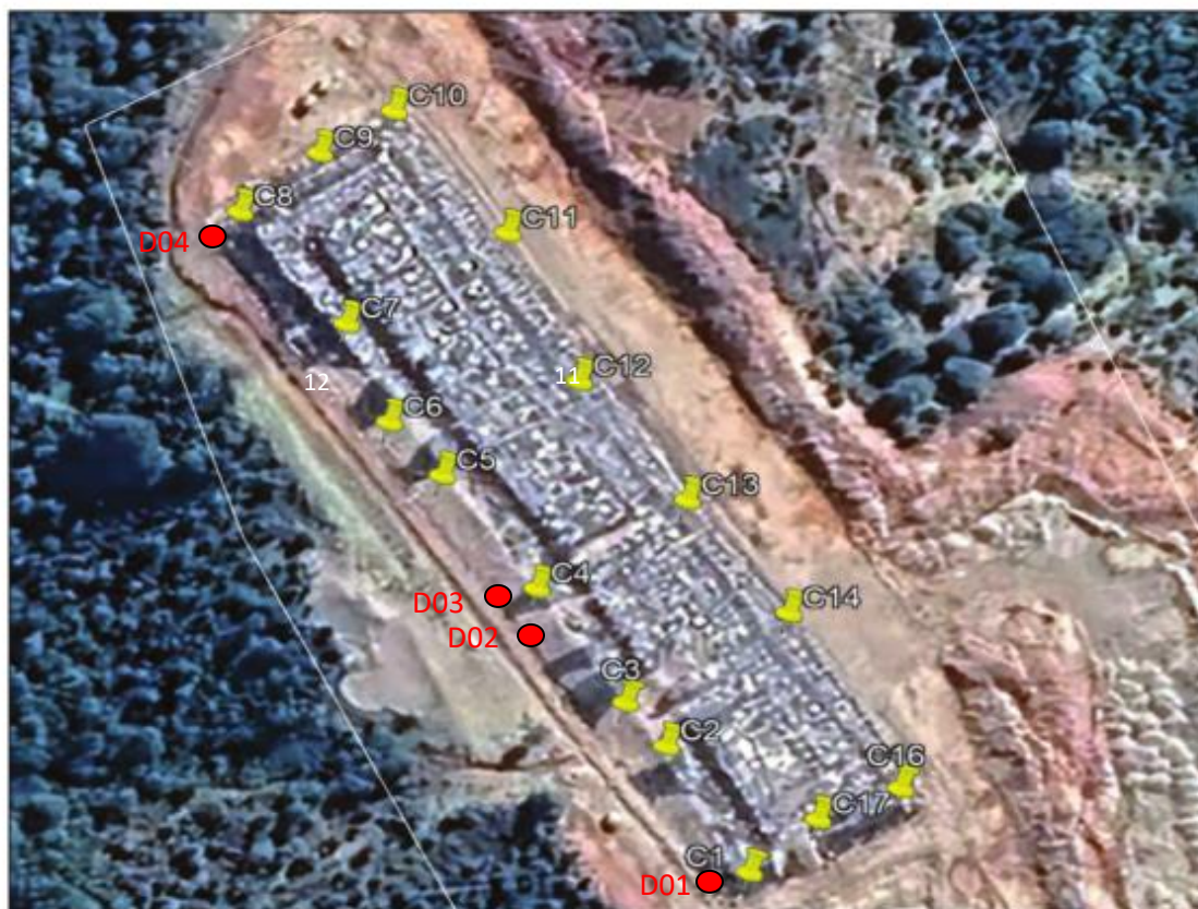
Fotografía N°15: Zanja Sanitaria N°1- Parte Norte. Imagen Aérea I. Municipalidad de Ancud.