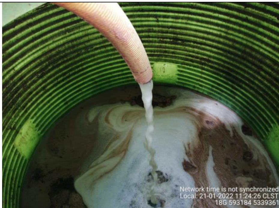
Fotografía N°12: Extracción de Lixiviados por personal municipal. Tomada: Viernes 21 de Enero del 2022.