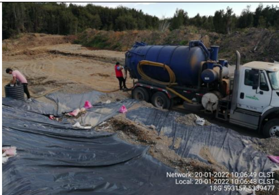
Fotografía N°10: Retiro de Lixiviados por empresa Tresol desde cámaras. Tomada: Jueves 20 de Enero del 2022.