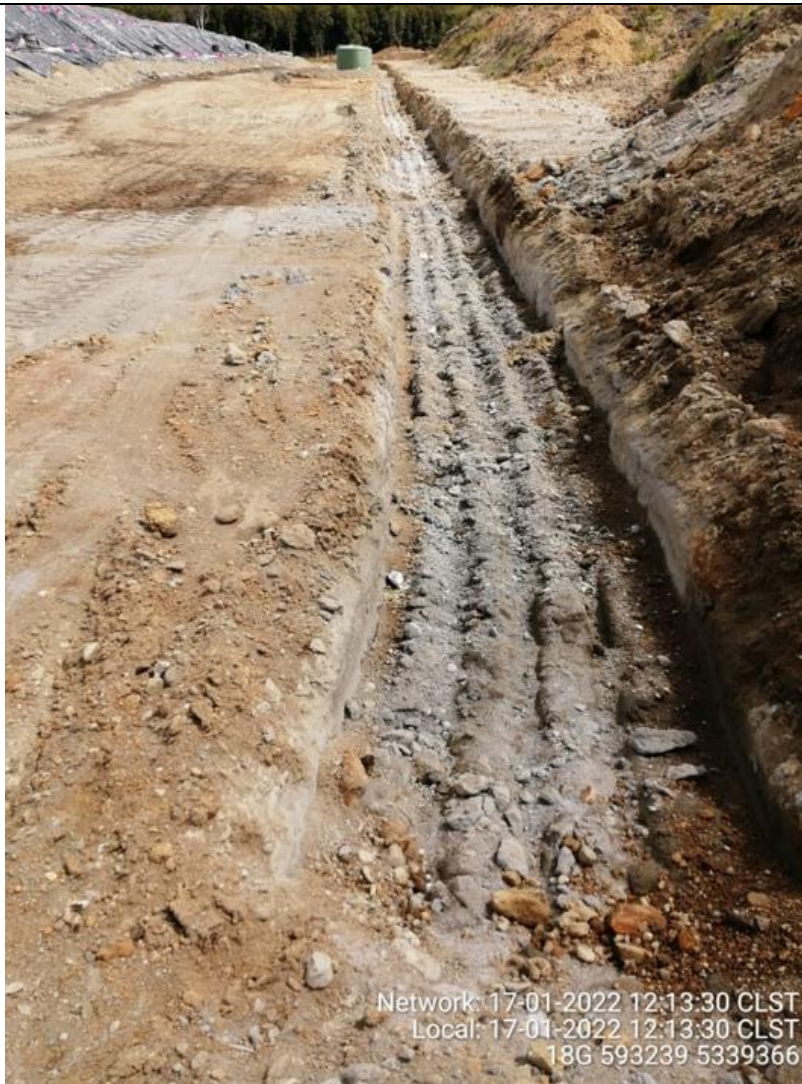
Fotografía N°22: Estado canales aguas lluvias