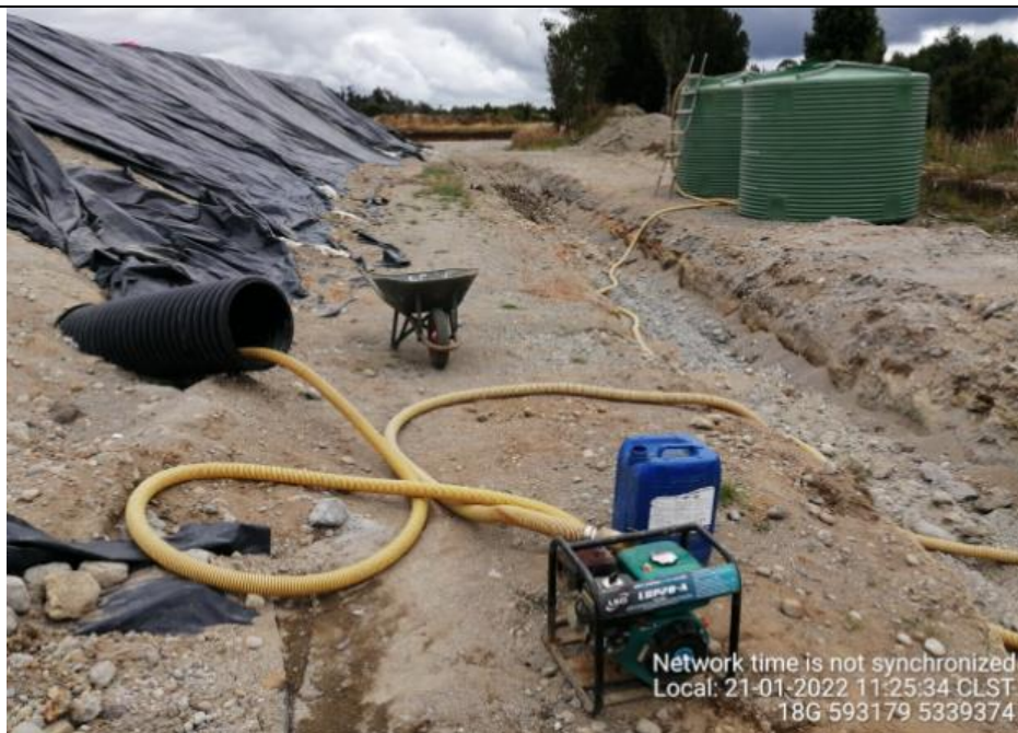
Fotografía N°11: Extracción de Lixiviados desde diagonal D02 por personal municipal. Tomada: Viernes 21 de Enero del 2022.