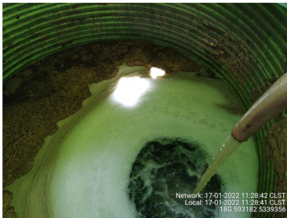
Fotografía N°3: Retiro de Lixiviados a estanque por Personal Municipal. Tomada: Lunes 17 de Enero del 2022.