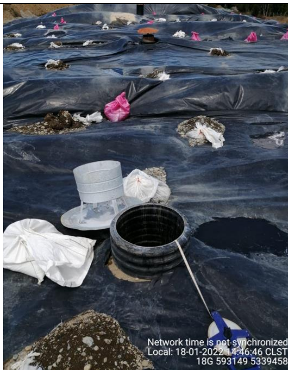
Fotografía N°17: Medición de Niveles de cámaras por Personal Municipal. Tomada: 18 de Enero del 2022.