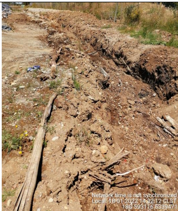
Fotografía N°23: Estado canales aguas lluvias