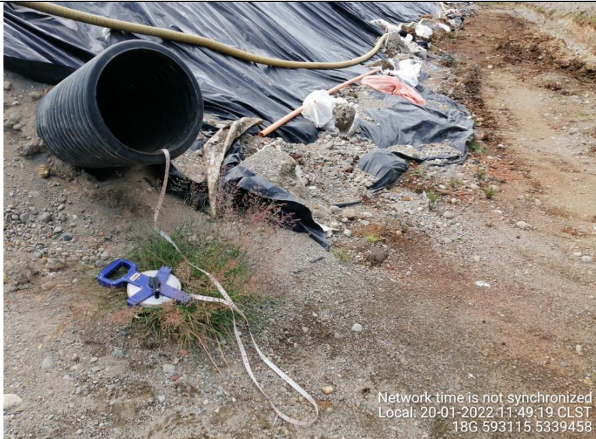
Fotografía N°19: Medición de Niveles de cámaras por Personal Municipal. Tomada: 20 de Enero del 2022.