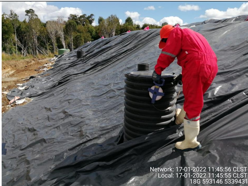
Fotografía N°16: Medición de Niveles de cámaras por Personal Municipal. Tomada: 17 de Enero del 2022.