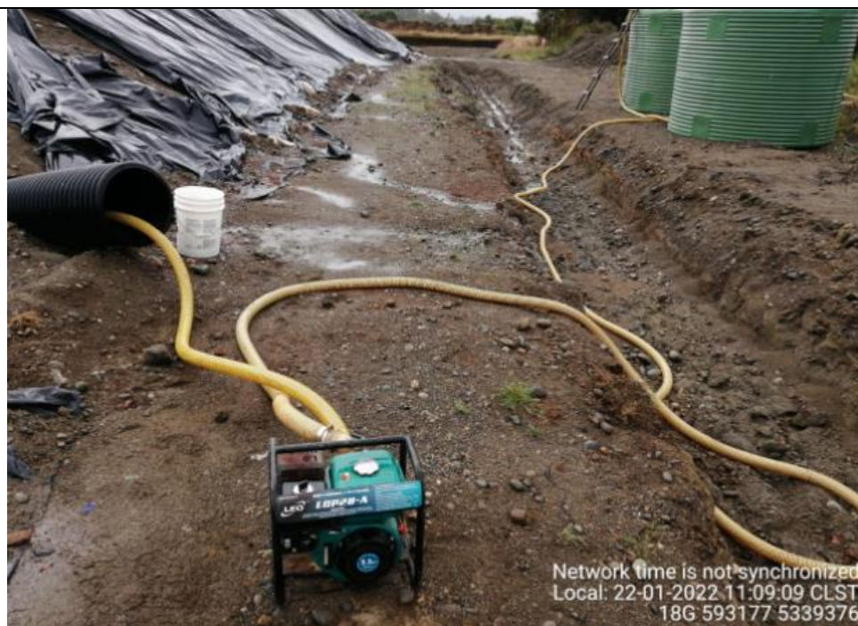
Fotografía N°13: Extracción de Lixiviados por personal municipal. Tomada: Sábado 22 de Enero del 2022.