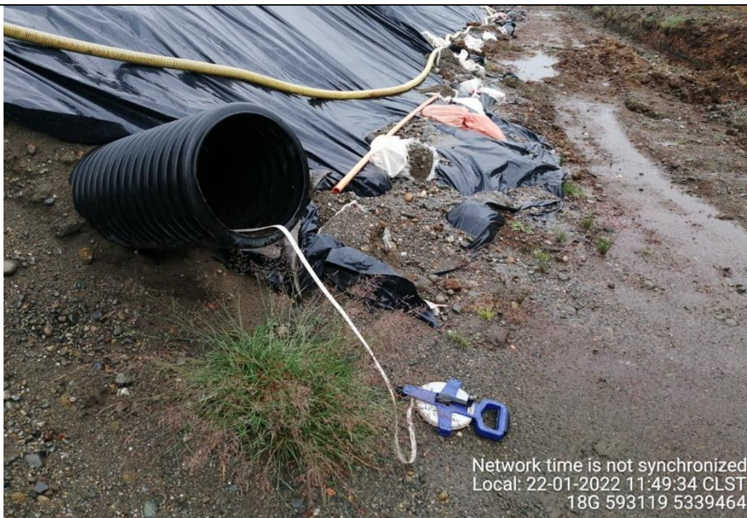
Fotografía N°21: Medición de Niveles de cámaras por Personal Municipal. Tomada: 22 de Enero del 2022.